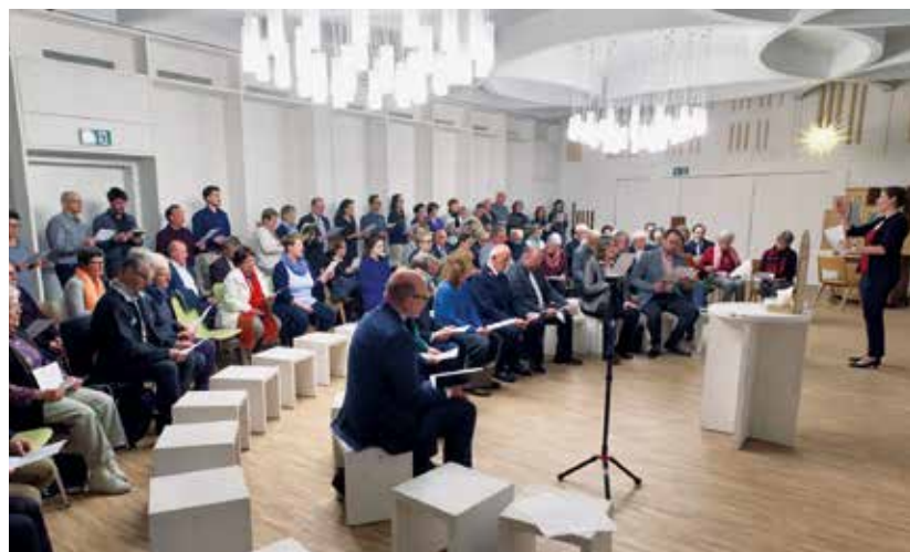
Feierstunde Haus der Religionen

Die Arbeitsgemeinschaft der Kirchen im Kanton Bern (AKB) lud am Sonntag, 19. November 2017, zu einer ökumenischen Feierstunde ins Haus der Religionen am Europaplatz in Bern ein. Das