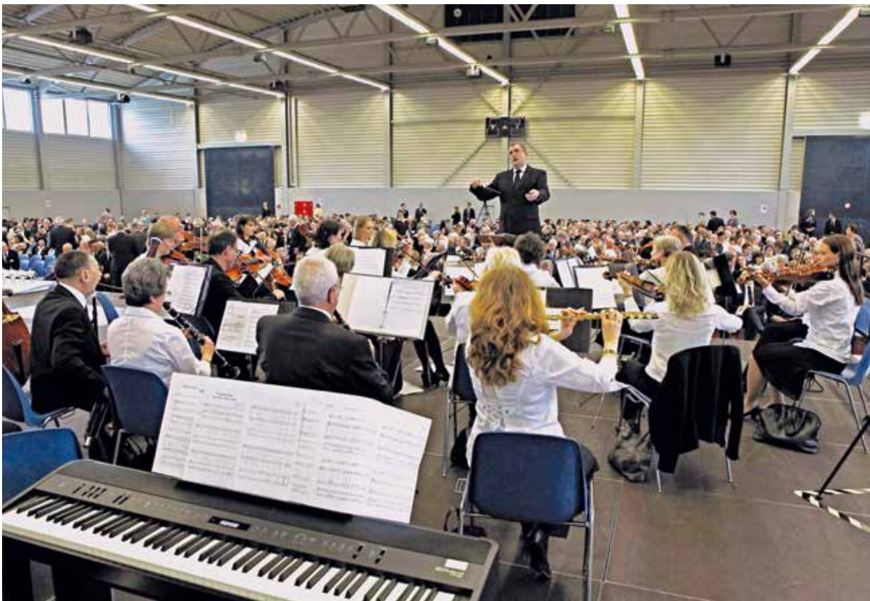
Musikbeitrag des Orchesters

handeln, zu leben und zu entscheiden“, gab der Bezirksapostel den Teilnehmern mit auf den Weg.