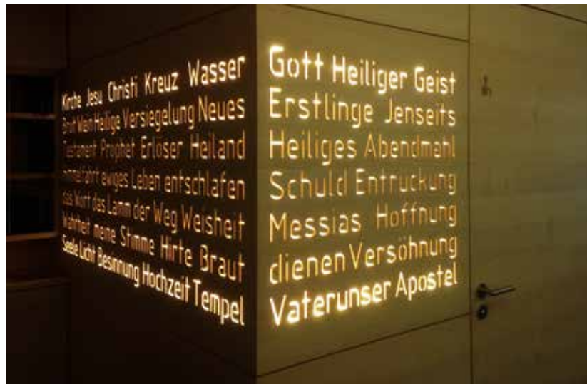
Eingangsbereich des neuen Kirchenlokals in Visp

Anfang März 2016 war die Grundsteinlegung für eine neue