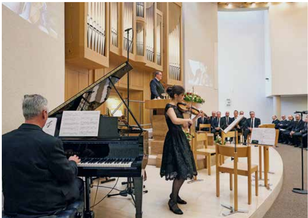
Musikbeitrag im Stammapostel- gottesdienst vom 1. Januar 2017 in Ostermundigen

Es sind keine Ereignisse nach dem Bilanzstichtag bekannt, welche einen Einfluss auf die Jahresrechnung 2017 haben.