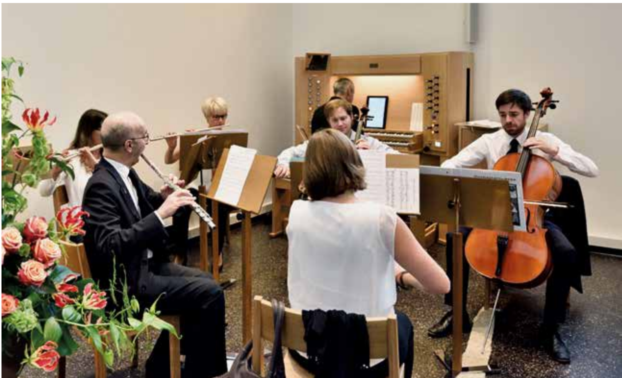
Orchester der Gemeinde Zürich-Affoltern