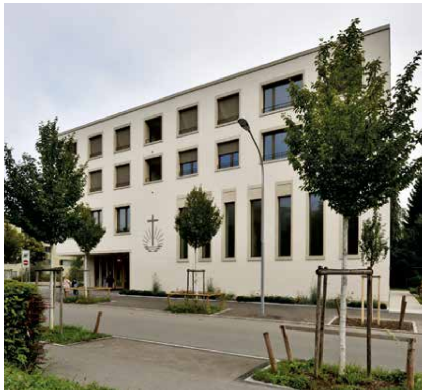
Das neue Kirchengebäude in Zürich-Affoltern