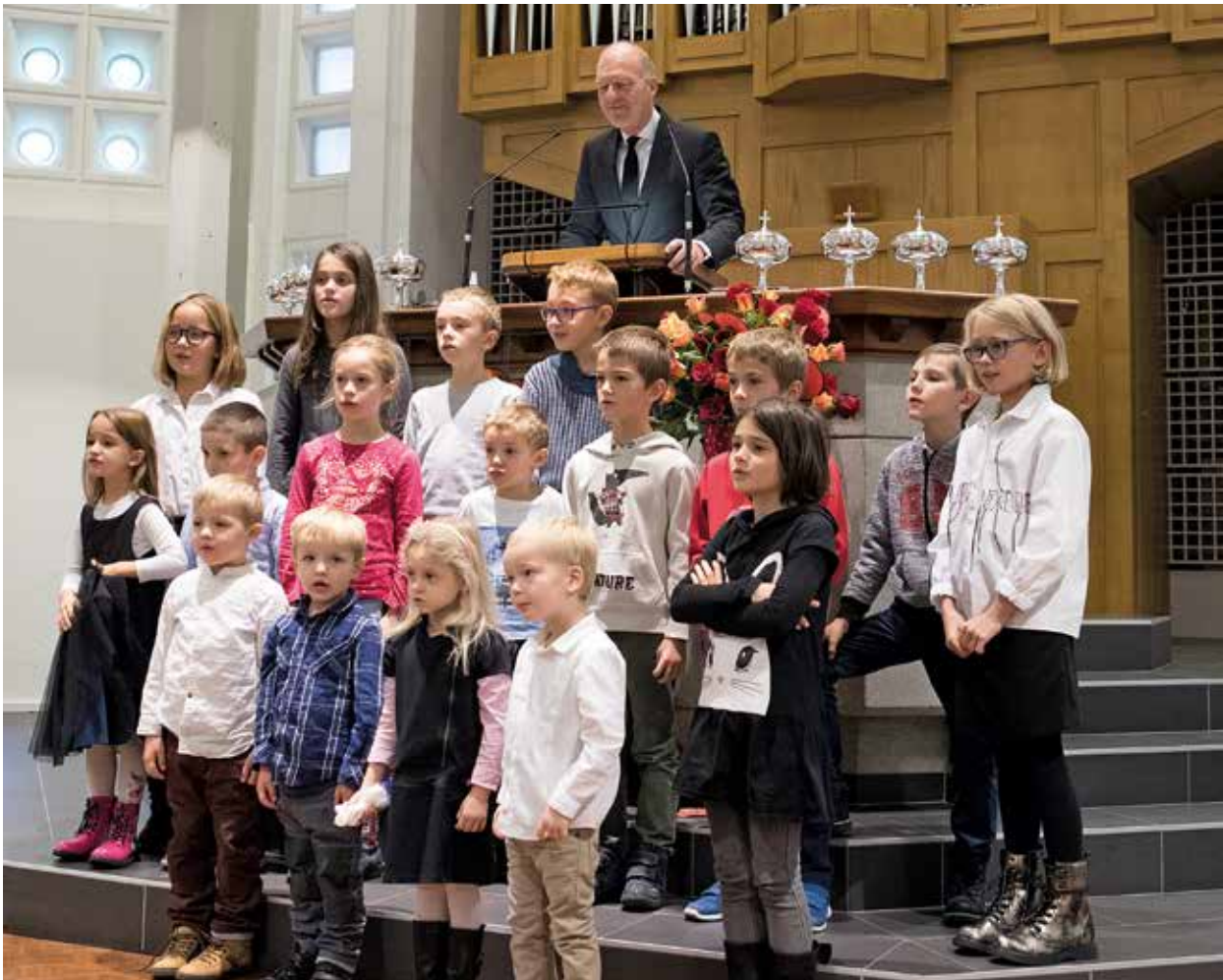
Ein Kinderchor singt im ersten Gottesdienst der zusammengeführten Gemeinde Genf

des Angebots würdiger, den jeweiligen Verhältnissen angepasster Versammlungsräume für die Gläubigen.