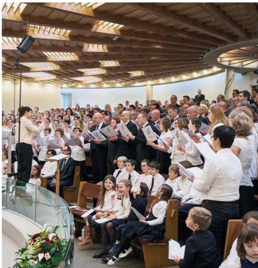
Liedvortrag des Chores im Stammapostelgottesdienst vom 1. Januar 2017 in Ostermundigen

Nach einem einjährigen Pilotbetrieb der Krankenübertragungen per IPTV wurde das System in den laufenden Betrieb übernommen. Per 1. Oktober 2017 wurde der Empfangsbereich auf die gesamte Gebietskirche Schweiz ausgeweitet. Ausserdem wurden mit Bern-Ostermundigen, Zürich-Affoltern und St. Gallen drei weitere Sendestellen in Betrieb genommen. Diese senden abwechselungsweise jeden Sonntag. Mittlerweile profitieren über 50 Geschwister in der Deutschschweiz von diesem Angebot.