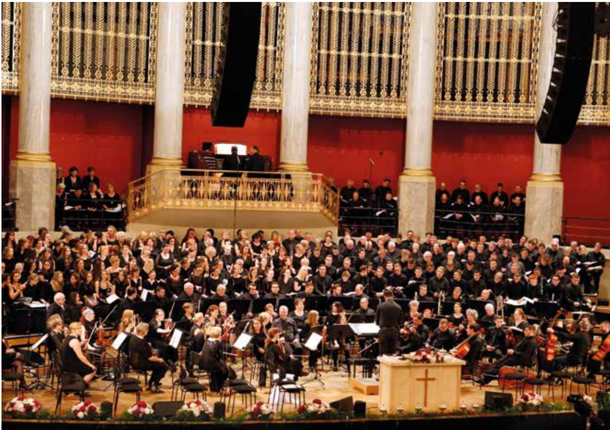
Orchester und Chor auf der Bühne des Konzerthauses

land) unterstrichen in ihren Predigtbeiträgen diese Aussagen und wiesen auch voll Vertrauen auf die Jugend hin, die im samstäglichen Konzert ein überzeugendes Bekenntnis zu ihrem Weg mit Jesus abgelegt habe.