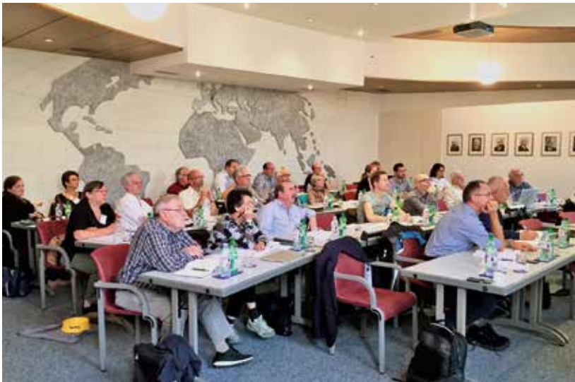
Teilnehmer der Webmasterschulung