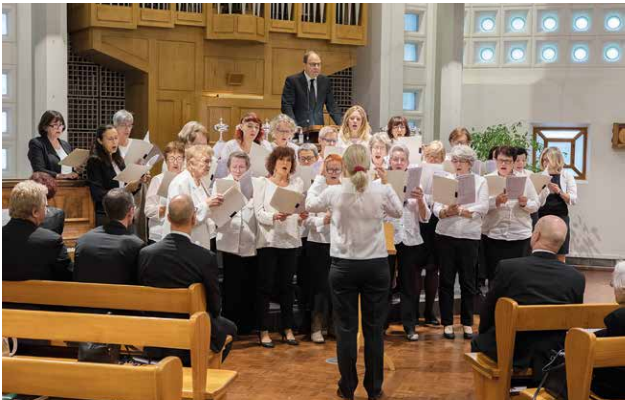
Chor im Gottesdienst in Genf