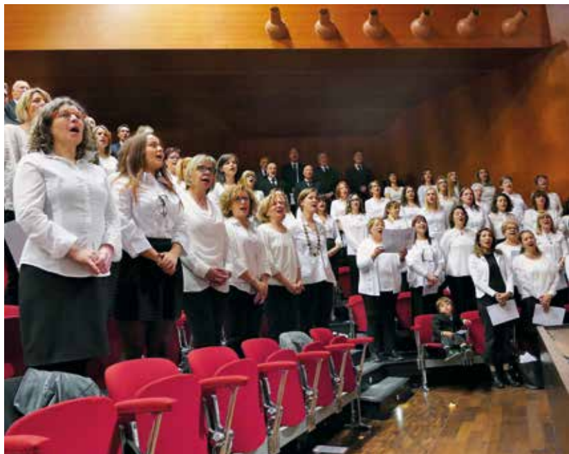
Liedvortrag des Chores im Gottesdienst in Lugano