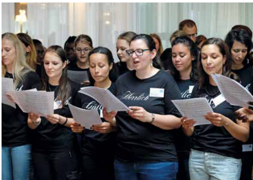
Wiener Jugend singt zur Begrüssung

330 Musikerinnen und Musiker hatten sich rund ein Jahr lang auf das Konzert und die musikalische Gestaltung des Pfingstgottesdienstes vorbereitet. Von der „musikwerkstattoesterreich“