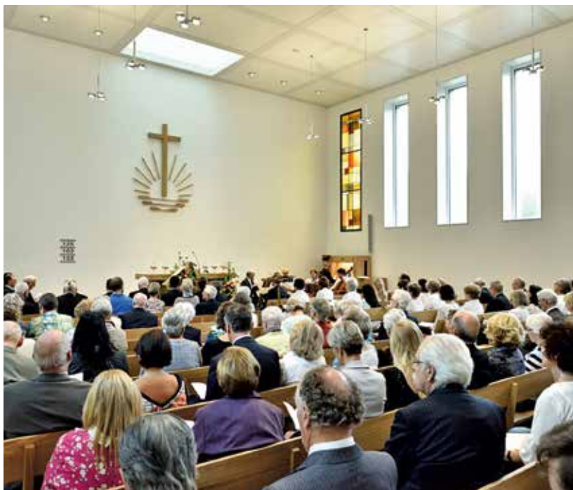
Der moderne, helle Kirchensaal

Nach mehrjähriger Planung erfolgte im August 2016 die Grundsteinlegung der neuen