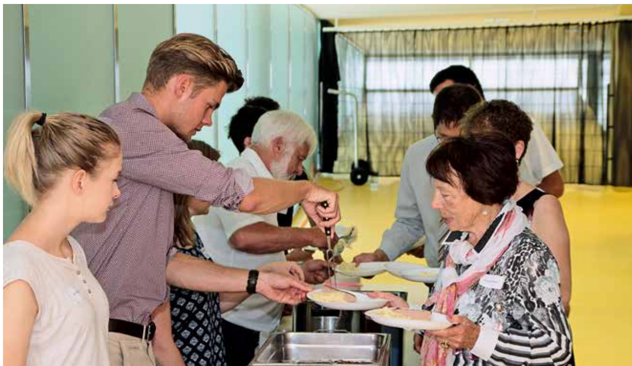
Gemeinschaftspflege am Handicapped Schweiz-Tag

Die Teilnehmer trafen am Sonntag, 25. Juni 2017, schon früh morgens in Bülach ein und ge-