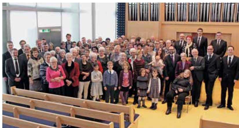
Gottesdienst in Bülach

Eine festlich geschmückte Gemeinde versammelte sich an Ostern 2017, um ihr 100-jähriges Bestehen zu feiern. Höhepunkt des Jubiläums war der Gottesdienst mit Apostel Jürg Zbinden,