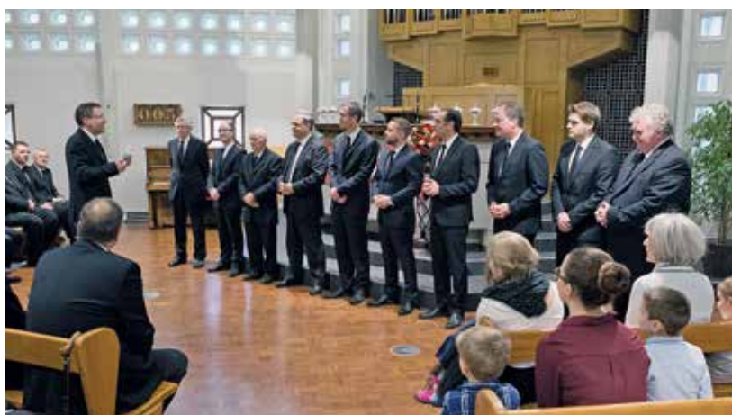
Bestätigung der Amtsträger in der neu zusammengeführten Gemeinde Genf