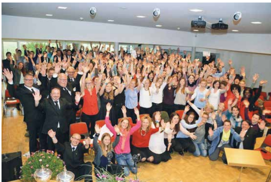
Meet'n Sing-Sängerinnen und Sänger