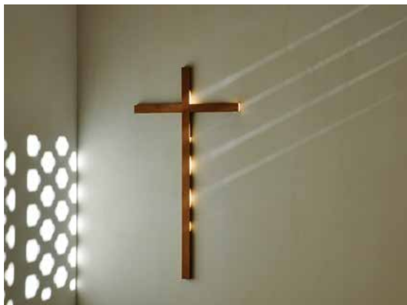
Das Kreuz - Blickfang im Kirchensaal

einer christlichen Kirche Ausdruck. Das Gebäude passe an diesen Ort und das Leben komme mit den Bewohnern und Bewohnerinnen. Gottes Geist solle spürbar sein und Gottes Segen uns in die Zukunft begleiten.