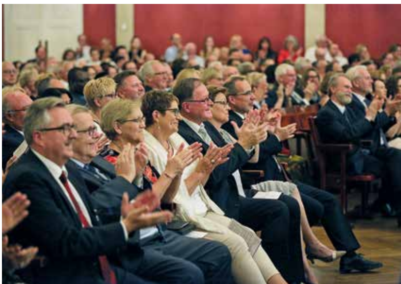
Freude und Begeisterung in den Gesichtern der Konzertbesucher