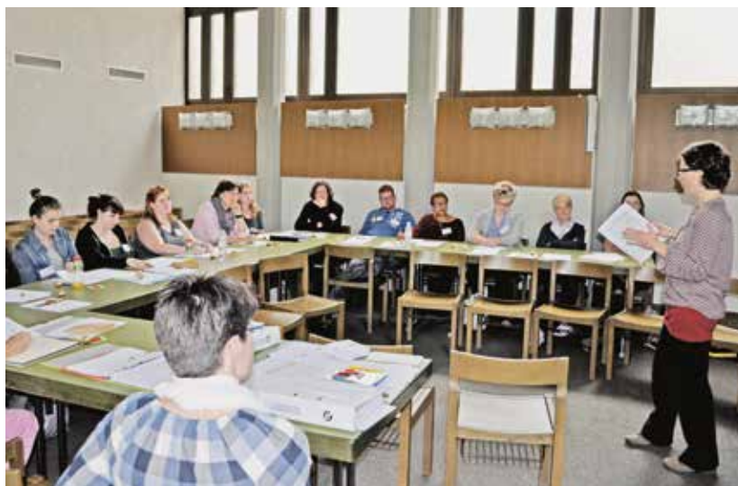
Gruppenarbeit am Basiskurs für neue Lehrpersonen

Höhepunkt war das Konzert am Ostersonntagnachmittag, 16. April 2017, in der Kirche St. Martin in Baar. Der Projektchor Meet'n Sing präsentierte ein abwechslungsreiches und buntes Repertoire aus geistlichen Liedern, bekannten Gospels und ergreifenden Rhythmen. Die Konzertbesucher kamen voll auf ihre Kosten und liessen sich von den stimmungsvollen, mitreisenden Liedern sichtlich begeistern.