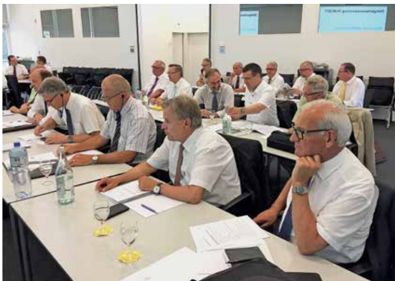
Teilnehmer der Delegiertenversammlung

In Zürich fand am Samstag, 24. Juni 2017, die jährliche Delegiertenversammlung statt.