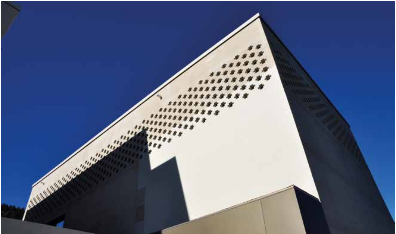
Aussenansicht der neuen Kirche in Buchs

Kirche am Nordeingang der Stadt Buchs im St. Galler Rheintal. Vierzehn Monate später konnte der Bau vollendet werden. Die Freude bei den Glaubensgeschwistern der Gemeinde Buchs war gross, konnten sie doch von ihrer über 60-jährigen Versammlungsstätte in ein modernes, sakrales und zeitgemässes Kirchengebäude umziehen.