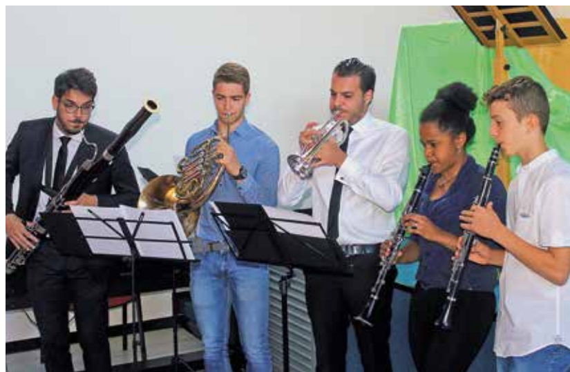
Musikvortrag des Instrumentalensembles

ersten Tag nach dem Mittagessen den interessanten und anspruchsvollen Fragen aus dem Kreis der Jugendlichen. Am Abend wurden von den Jugendlichen verschiedene Theaterszenen passend zum Jahresmotto aufgeführt und ein Chor trug verschiedene Lieder vor.