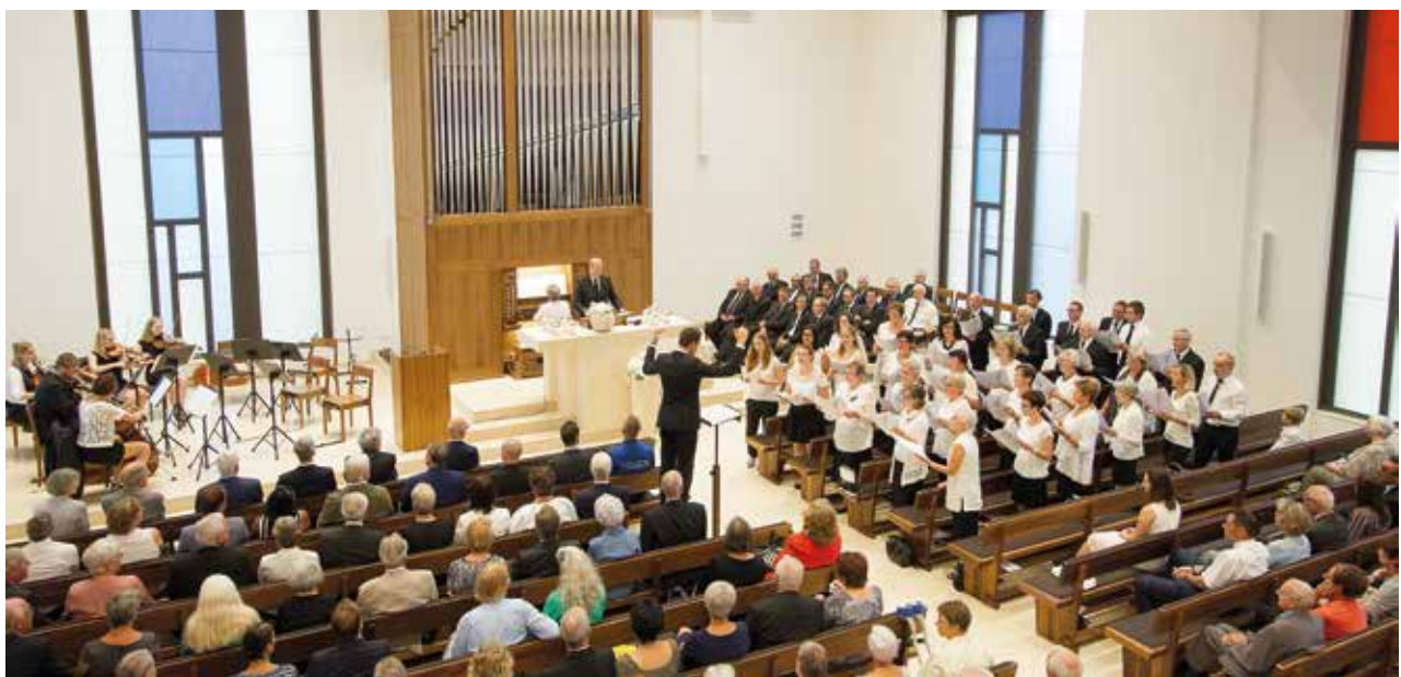
Blick in den Kirchensaal in St. Gallen

Als Grundlage für den Gottesdienst zur Einweihung diente der Bezirksapostelhelfer mit dem Bibelwort aus 1. Mose 28,17: „Wie heilig ist diese Stätte! Hier ist nichts anderes als Gottes Haus, und hier ist die Pforte des Himmels.“